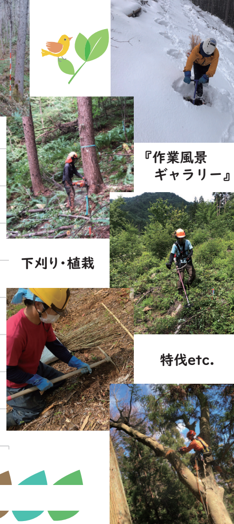
『作業風景ギャラリー』