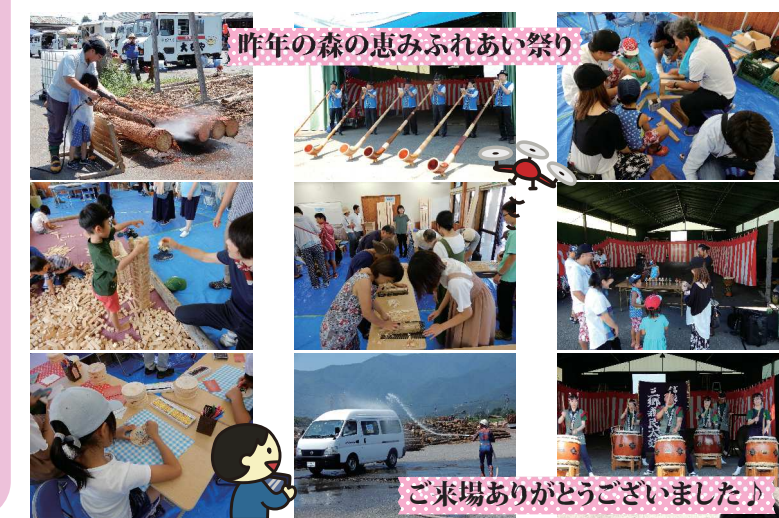
ご来場ありがとうございました

平成25年より中信木材センターと合同で8月の第一土曜日に開催して参りました『森の恵みふれあい祭り』は、今年度、新型コロナウイルス感染症防止のため、中止とさせて頂きました。例年、各種出店やイベントステージでの演奏・演舞、また食品移動販売等の皆様方に支えられ、ここ数年は毎回300名以上の方々が足を運んでくださいました。 世の中の情勢により仕方のないことではありますが、今年度はみなさまの楽しむ姿が見られないことが残念でなりません。次年度に向けて、また新たに楽しい企画を考える期間ととらえ、イベント企画をまいります。