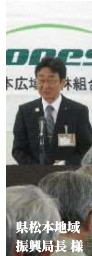
県松本地域振興局長 様

長野県松本地域振興局長 様 長野県松本地域振興局長 様 長野県松本地域振興局長 様