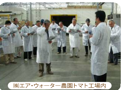
(株)エア・ウォーター農園トマト工場内

中東から主に輸入されたLPガスを暖房等に使用していますが、この化石燃料による輸入エネルギーを、木質バイオマスエネルギーへと転換する計画の事業概要等について説明をしていただきました。