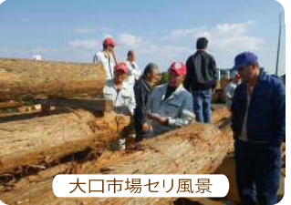
大口市場セリ風景