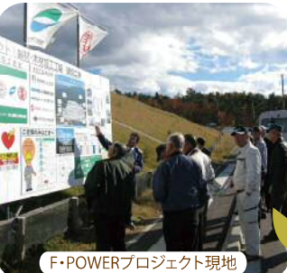
F・POWERプロジェクト現場