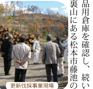
更新伐採事業現場

今回の研修は、地域材の有効利用推進を図るうえで間伐材、未利用木材並びに松くい虫による松枯れ材の供給先として期待を込め、林業サイクルの構築を図る起爆剤になればと思っております。(更新伐事業及びF・POWERプロジェクト)に関する記事も合わせてご覧ください。