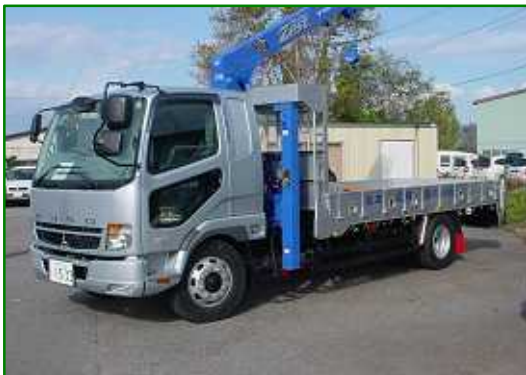
クレーン付トラック