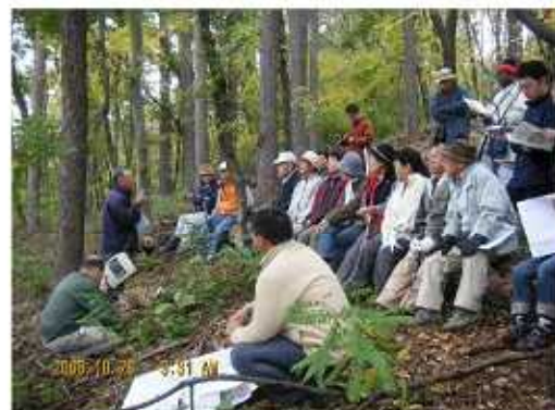
[バスツアーの開催状況]