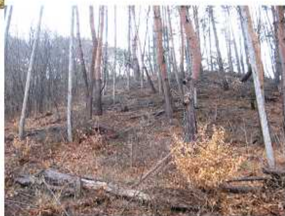
保育間伐されたアカマツ・カラマツの混交林（松本市 四賀）