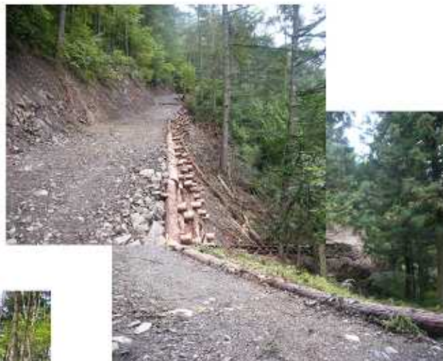
間伐のために開設した作業道（安曇野市 黒沢）