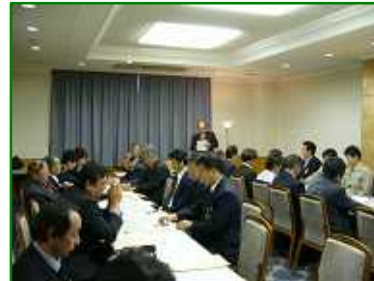
全体会議・部会の報告