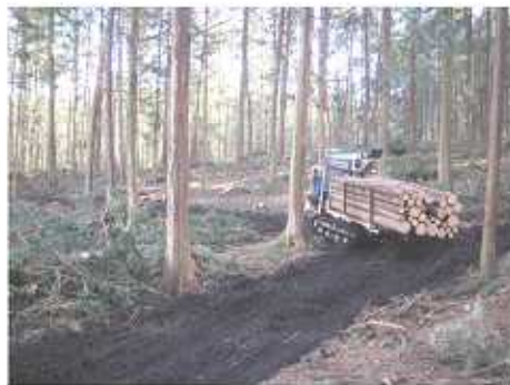
間伐とフォワーダによる搬出（安曇野市 穂高）