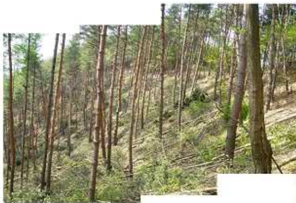
切捨てによる保育間伐をしたアカマツ林（塩尻市）