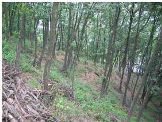
広葉樹アカシアの整備（松本市 並柳）