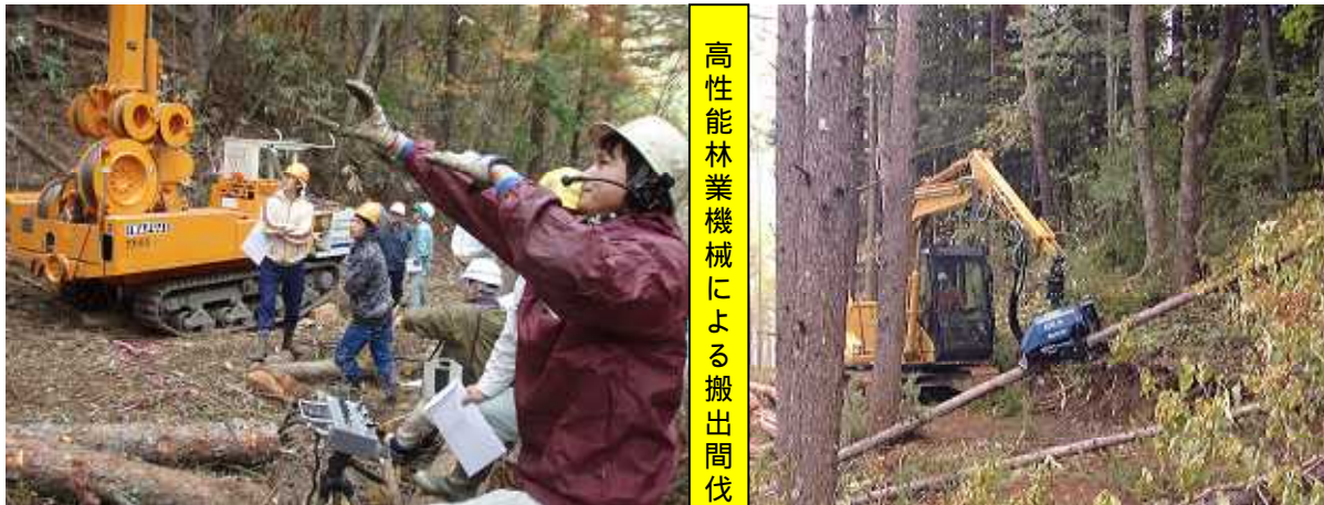
高性能林業機械による搬出間伐